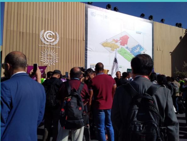
Photographie d'un regroupement à la COP27, le 9 novembre 2022

Le 9 novembre étant le jour de la finance, l'ONG Oil Change International [3] a par exemple organisé une manifestation pour demander aux pays d'arrêter de financer les énergies fossiles, avec en ligne de mire le Japon, la Corée du Sud et la Chine, qui seraient les 3 principaux financeurs (publics) de l'industrie fossile. [4] [5]