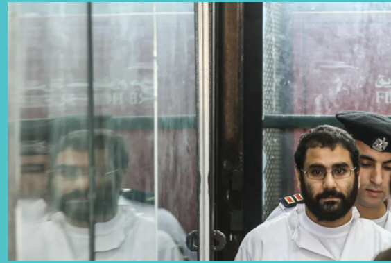
Alaa Abd el-Fattah in Cairo, Egypt, in 2014 [3]

Le militant égyptien Alaa Abdel Fattah, déjà en grève de la faim depuis mardi dernier, a entamé une grève de la soif dimanche. Un geste pour attirer l'attention sur la condition des détenu·es d'opinion emprisonné·es en Égypte. Le Premier ministre britannique Rishi Sunak a annoncé lundi que son cas était une « priorité » et qu'il serait discuté à la COP27. [2]