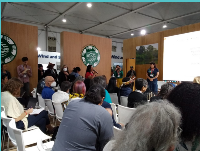
Photographie du témoignage de représentantes de communautés indigènes du Mexique au pavillon indigène

Suite au récit de ces communautés, il a pu entamer des démarches juridiques et a également écrit une série de recommandations à l'intention de l'assemblée des Nations Unies.